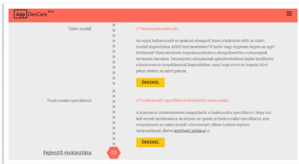
2. ábra - Az ideális fejlesztési folyamat a kapcsolódó szolgáltatásokkal

Az AppDevCare projekt keretében kialakításra került egy saját mobilkutatási panel, melynek felhasználásával kvalitatív kutatásokat lehet véghez vinni. A keretrendszer megalkotása során létrejött egy széleskörű tudásbázis és know-how a mobilsoftver fejlesztés területén, mely a Tengen Kft-ben már rendelkezésre álló piackutatási-tanácsadási kompetenciákkal kombinálva lehetővé teszi a szolgáltatás nyújtását.